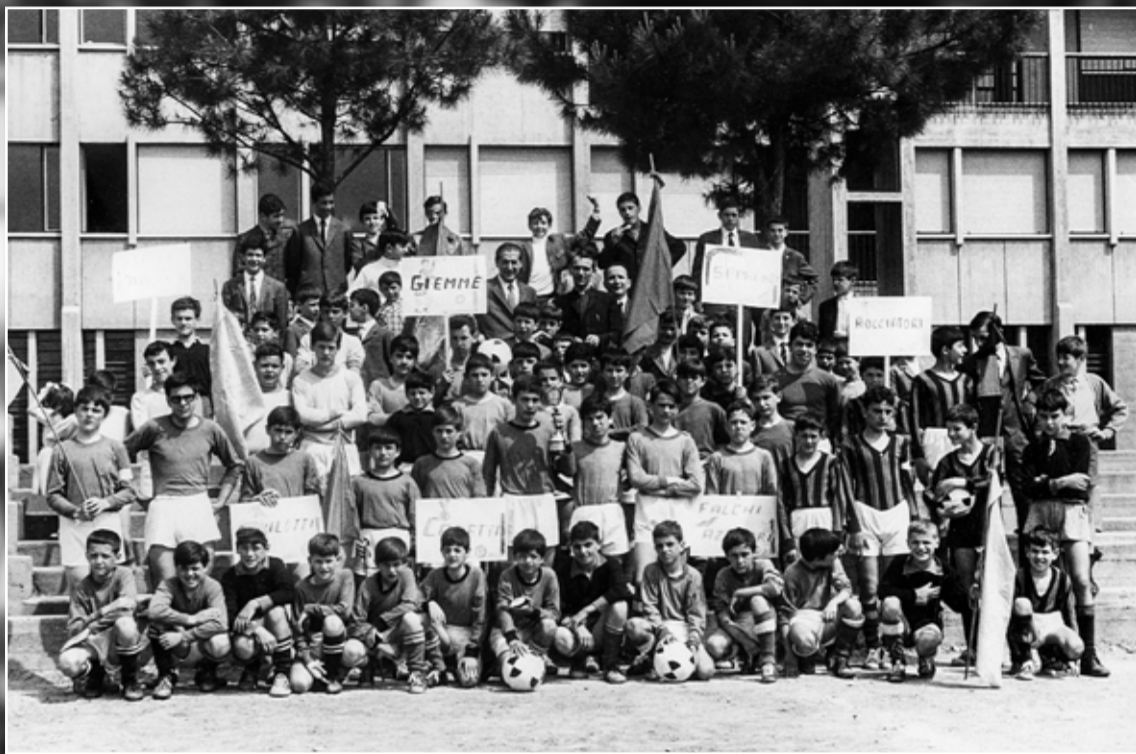
Le squadre partecipanti al 4° Palio Primavera organizzato nel 1969.