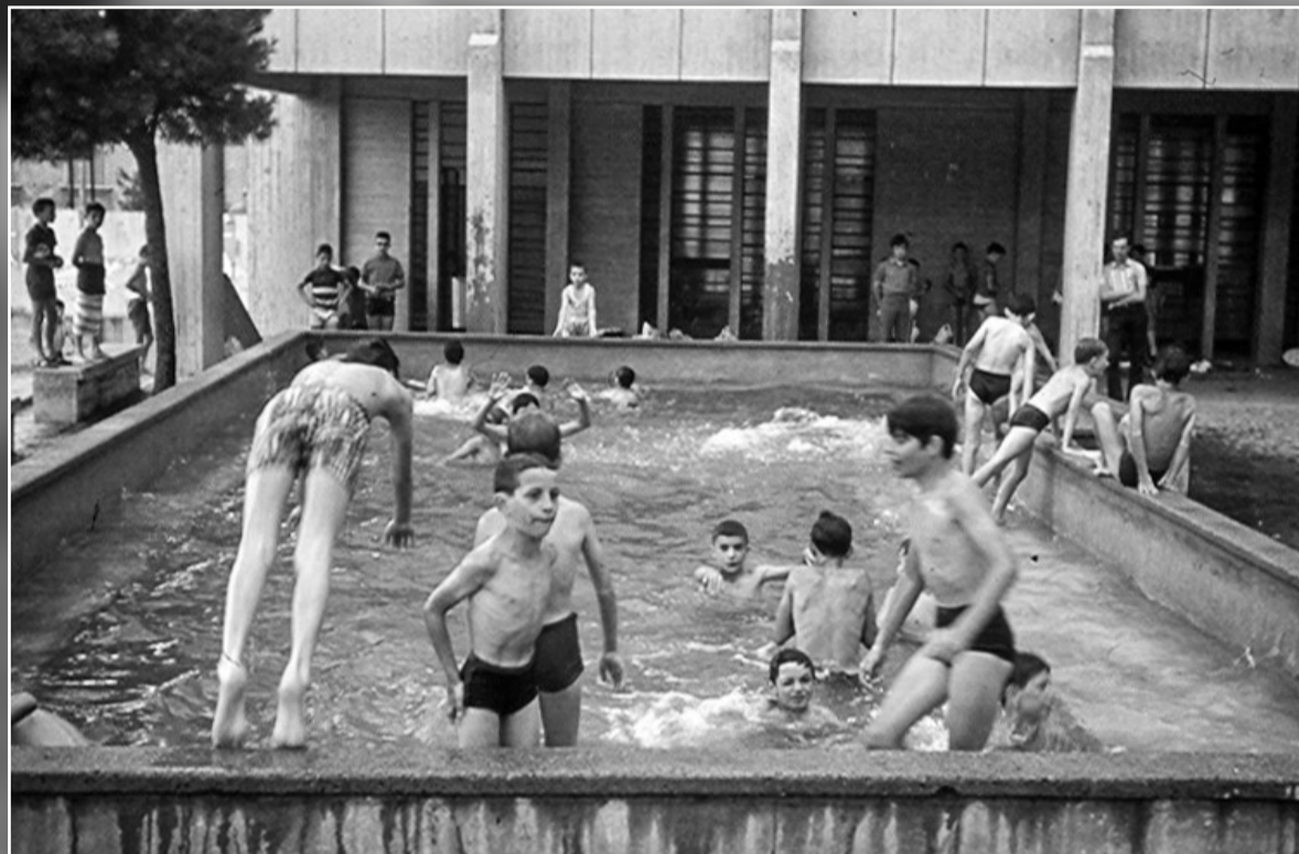
Ci si rinfresca nella piscina costruita all'interno dell'Oratorio di Vicolo Scotti: siamo nel 1969.