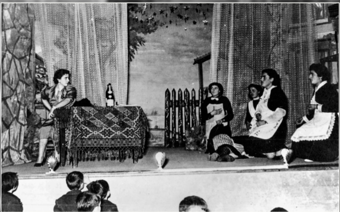
Scena di teatro all'Oratorio di Locate negli anni '50.