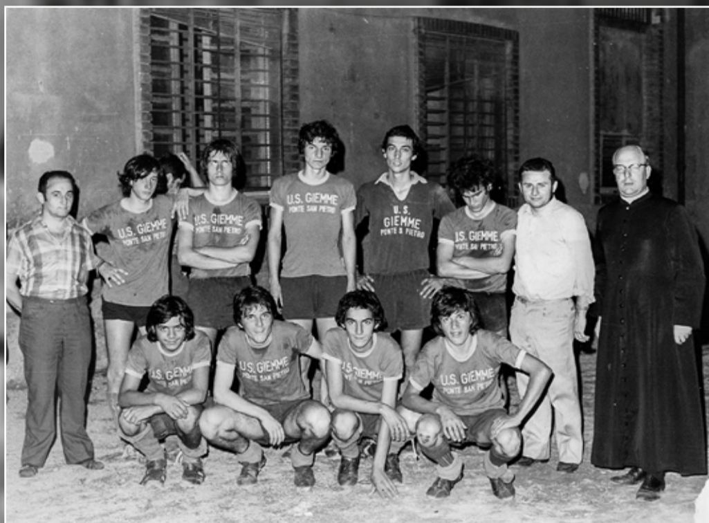
La squadra di calcio che ha partecipato al Palio di Bergamo del 1973.