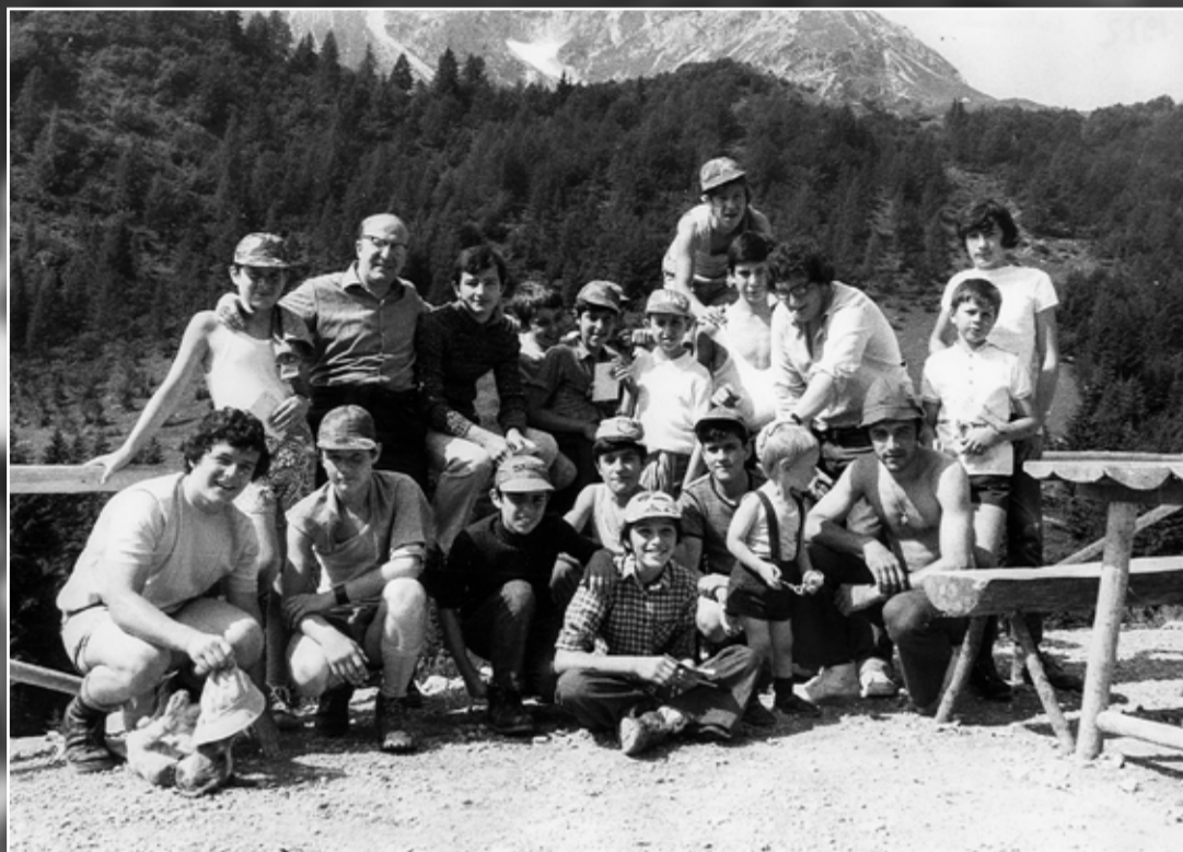
Ragazzi dell'Oratorio di Ponte in campeggio a Valcanale nel 1972.