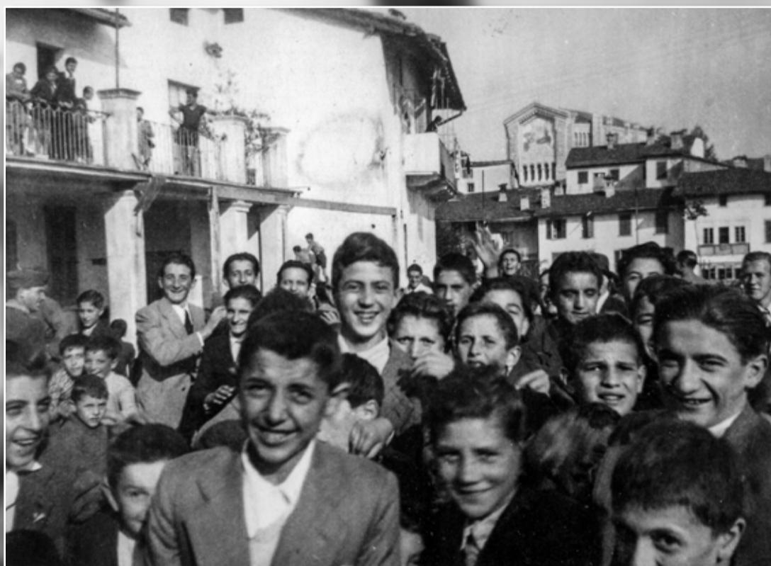
Ragazzi festosi presso il vecchio Oratorio di Ponte negli anni '40 del secolo scorso.