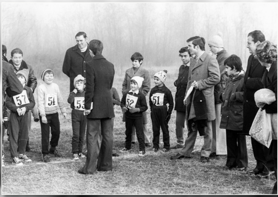
Bambini infreddoliti in attesa della partenza della 6a corsa campestre, che si è tenuta nel 1974.